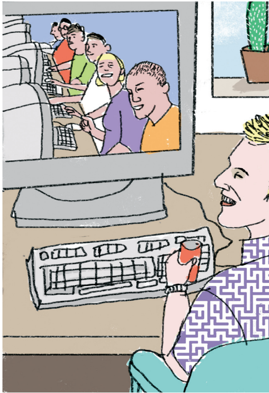
איור: מיכל בוננו

ויציג אותה. תפקידו של המורה בדיון מסוג זה איננו להיות ספק הידע אלא מחווה הדעה, המסכם, נותן המשוב וההערכה - אותו תפקיד חשוב שהועיד לו פרופ' סלומון. מבחינות אלו עולה הדיון המקוון על הדיון המתנהל בכיתה, וטוב יעשו מורים, גם בקורסים המתנהלים ברובם פנים-אל-פנים, אם יוסיפו לתכנית הקורס דיונים מקוונים בנושאי הלימוד או בנושאי הרחבה, שהתלמידים צריכים לעבד בעצמם.