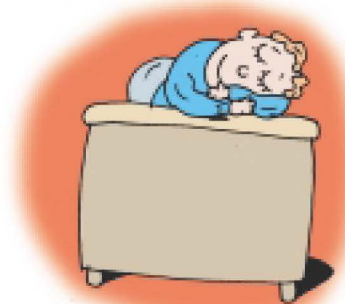
איורים: נתן הלפרין

4. דבר לאט עד שכולם ירדמו, או דבר כל כך מהר שאיש לא יספיק לכתוב. העתק ישר מהמחברת שלך אל הלוח מבלי להסביר. הסתכל תמיד לתוך המחברת ולא לתלמידים, הפנה את הגב לכיתה ואת הפנים ללוח ודבר בשקט, אל עצמך. זוהי קומבינציה אידאלית להבריא את הסטודנט החרוץ ביותר.